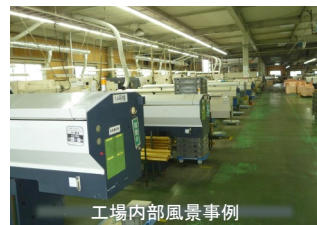
工場内部風景事例