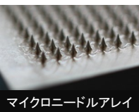
マイクロニードルアレイ

当社では、これまで培った微細加工技術を柱にして、世の中が求めるものに直結する技術・商品を開発していく。一つ目は医療分野であり、二つ目は自動運転や高速通信分野であり、それぞれの分野で精密加工技術を活かせることが分かったので、医工連携並びに自動化・高速通信分野をキーにして大学の先生方の研究内容と連携して、新しい製品の商品化・実用化に繋げていく。そのための一環として「微細加工工業会」が2018年11月に活動開始し当社もその一員となって活動を展開しております。(日本経済新聞)