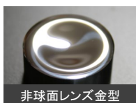
非球面レンズ金型