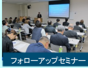
フォローアップセミナー