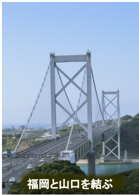
福岡と山口を結ぶ