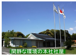
閑静な環境の本社社屋

当社は国内外の医療機器並びに自動化機器メーカーから熱い視線を受けており、医療機器関連では、痛みを感じさせない注射針「マイクロニードルアレイ」並びにカプセル内視鏡です。自動化機器関連では自動運転関連機器、高速通信関連では第5世代高速通信分野で必要不可欠な部品製作技術を保有しております。