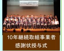
10年継続取組事業者 感謝状授与式