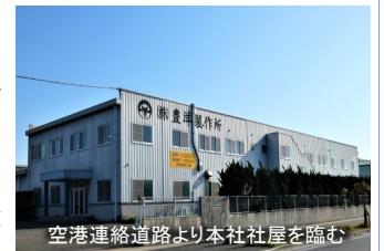
空港連絡道路より本社社屋を臨む