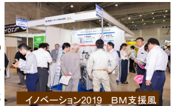
イノベーション2019 BM支援展

今回の支援は11年目で、展示会は10月に開催された。コーディネーター17名、出展企業48社(九州山口以外40%)、訪問企業216社、地元来場企業123社・面談・商談・見積・成約の合計は508件の成果を得た。